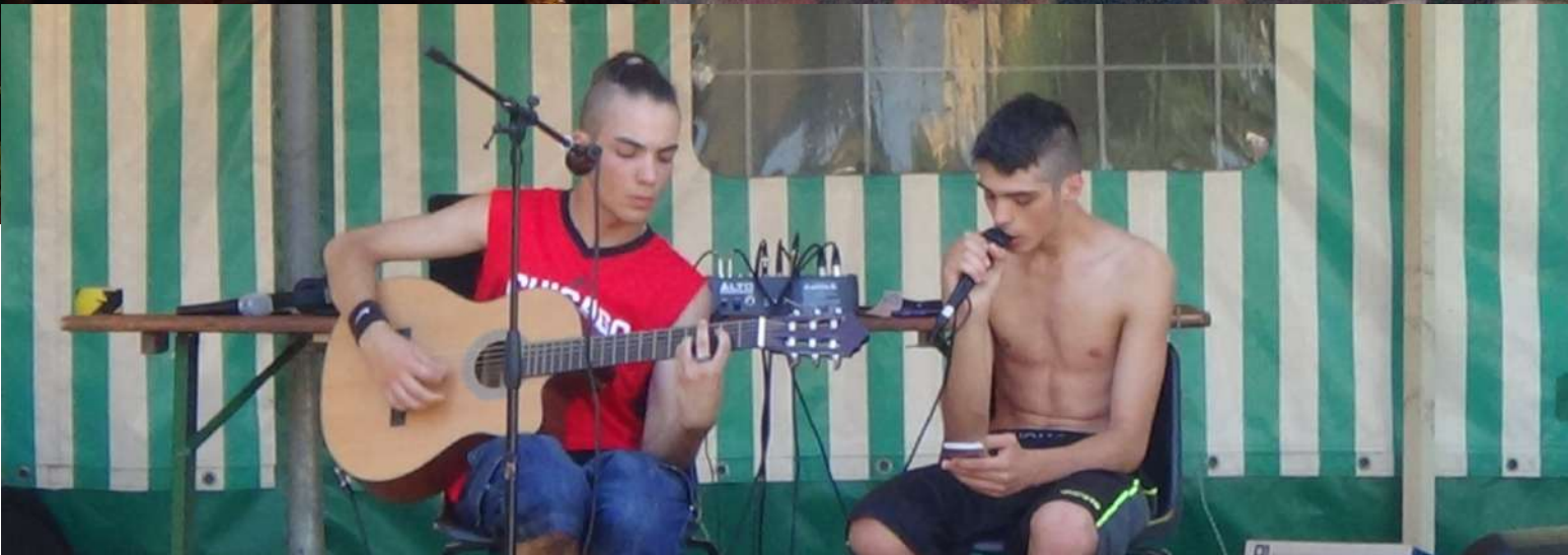
Creatività sociale, non solo come antidoto alla violenza, ma anche come strumento e metodo per scegliere, per ampliare l'arco delle possibilità. (SPACCO TUTTO Ed. Mimesis)