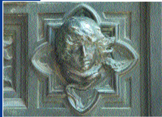
Autoritratto di Giuseppe Cassioli in una formella della porta laterale destra.

opera dell'architetto fiorentino Emilio De Fabris. La solenne inaugurazione avvenne il 12 maggio 1887. Le tre porte di bronzo furono realizzate, due da Augusto Passaglia (la maggiore centrale e quella laterale sinistra), mentre l'altra fu opera molto sofferta realizzata da Giuseppe Cassioli il quale, avendo nei lunghi anni di lavoro subito vessazioni, disgrazie e miseria, nel lasciarci il suo autoritratto in una delle testine del battente destro, volle raffigurarsi con una serpe intorno al collo nell'atto di soffocarlo.