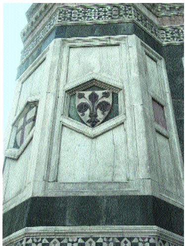
Formelle decorative sul Campanile con il giglio di Firenze e la Croce del Popolo.

rentina non poteva permettersi il lusso di continuare a finanziare l'intera opera. Questo superficiale giudizio offese la Signoria tanto da infliggere all'incauto veronese due mesi di prigione per vilipendio! Scontata la pena, il gonfaloniere Ruggeri Calcagni ordinandone la scarcerazione, volle però che prima di ripartire, fosse condotto a vedere l'opulenza dell'erario pubblico al fine di renderlo consapevole sull'effettiva solvibilità dei fiorentini i quali, non solo potevano permettersi il lusso di eseguire il ricco rivestimento al loro campanile, ma erano in grado di rivestire così l'intera città.