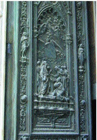
Porta laterale destra, dettaglio.

opera dell'architetto fiorentino Emilio De Fabris. La solenne inaugurazione avvenne il 12 maggio 1887. Le tre porte di bronzo furono realizzate, due da Augusto Passaglia (la maggiore centrale e quella laterale sinistra), mentre l'altra fu opera molto sofferta realizzata da Giuseppe Cassioli il quale, avendo nei lunghi anni di lavoro subito vessazioni, disgrazie e miseria, nel lasciarci il suo autoritratto in una delle testine del battente destro, volle raffigurarsi con una serpe intorno al collo nell'atto di soffocarlo.