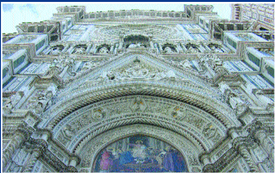
Santa Maria del Fiore, scorcio della facciata.

(dall'unione della Madonna con il giglio, simbolo della città), il Campanile di Giotto ed il già descritto Battistero di San Giovanni.