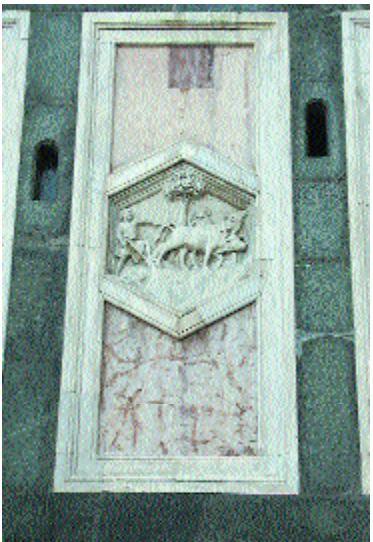
Sculture del Campanile.

nico insieme che fa del Campanile di Giotto, uno dei più mirabili d'Italia. Anche Carlo V detto "il Saggio", rimanendo entusiasticamente colpito dalla sua bellezza, esclamò: "È degno di essere coperto e mostrato di rado".