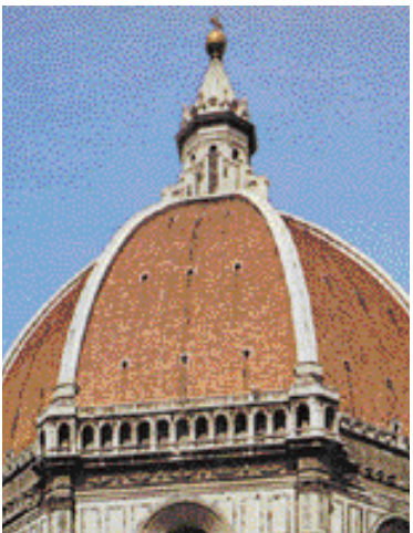
Particolare del tamburo con la “gabbia da grilli”. A destra, rilievi della porta laterale sinistra.

mata; secondo il progetto originario, infatti, avrebbe dovuto cingerla un ballatoio, ma dopo la morte del Brunelleschi, avvenuta nel 1446, smarriti che furono i suoi disegni, essa rimase incompiuta. Successivamente, Baccio d’Agnolo riprese i lavori in una delle otto facce del tamburo secondo un suo disegno, ma dopo che Michelangelo l’ebbe giudicato “una gabbia da grilli”, tutto rimase come prima.