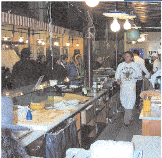
Banchi del Mercato Centrale.

ra. Ma il vero spettacolo del mercato è soprattutto costituito dalle persone: i venditori che decantano ad alta voce i pregi della loro mercanzia ed indirizzano giudizi più o meno galanti alle giovani ed avvenenti signore, gli avventori pronti a valutare con una sola occhiata la migliore combinazione fra qualità e prezzo. L'atmosfera che si respira è una vera e propria sinfonia di suoni e rumori, avvolta tra colori e profumi diversi man mano che si procede fra i vari, candidi, banchi di marmo.