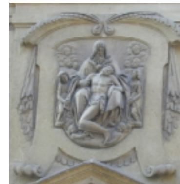
Il frontone raffigurante la Trinità.