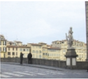
Ponte Santa Trinita, dal lato d'Oltrarno con la statua dell'"Inverno" di Taddeo Landini.

in un insieme di leggere stecche di legno che formavano una singolare grande gabbia a forma di cupola sotto la quale ad un gancio, si appendevano gli scaldini per rendere caldi i letti o per asciugare la biancheria, specialmente quella dei bambini.