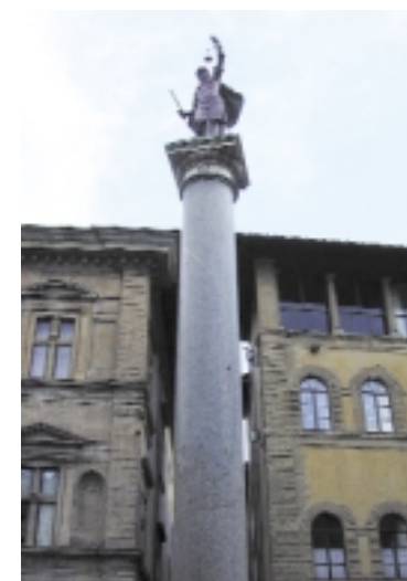
La Colonna della Giustizia.