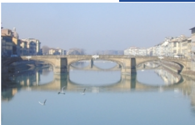
Il Ponte Santa Trinita.

Questo, nell'ordine di tempo, fu il quarto ponte ad unire le due sponde dell'Arno cittadino; costruito in legno nel 1252 per volere del nobile mercante Lamberto Frescobaldi, che risiedeva in piazza Santa Trinita, per sette anni divenne pure un'ottima terrazza per assistere alle feste che si svolgevano frequentemente sul fiume, terrazza talmente vissuta che, nel 1259, durante una rappresentazione, per l'enorme