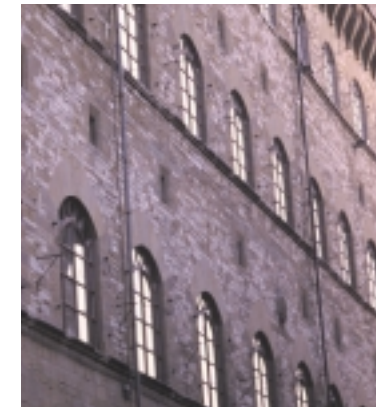
Palazzo Spini-Feroni, particolare della facciata.