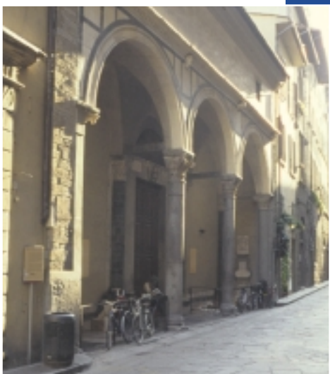
Camminando verso l'apertura, dopo una quindi-

Dopo aver percorso borgo San Iacopo per circa 150 metri, sul lato Nord si percepisce con facilità un'apertura in concomitanza di un allargamento del marciapiede.