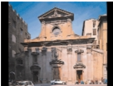
La chiesa di Santa Trinita.

Oltrepassato palazzo Spini-Feroni, sul lato opposto, vediamo la chiesa di Santa Trinita, dedicata a Dio assolutamente uno e relativamente trino nel Padre, Figlio e Spirito Santo. Sorse nell'XI secolo al posto di un più modesto oratorio per volontà dei monaci vallombrosani. Curiosamente fu detta e conosciuta subito dai fiorentini col nome di Santa Trinita, e non della Santissima Trinità come liturgicamente sarebbe stato più esatto.