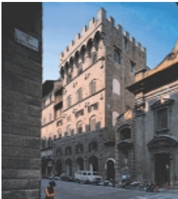
Scorcio da Piazza di Santa Trinita.

Attraversato il lungarno degli Acciaiuoli in direzione Nord, recuperato verso Ovest lo spostamento verso Est resosi necessario per l'attraversamento, ci si immette in via de' Tornabuoni e dopo un centinaio di metri, sempre sul lato Est della strada, si apre piazza Santa Trinita con la chiesa omonima.