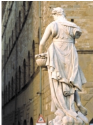
Ponte Santa Trinita: la "Primavera" di Pietro Francavilla.

(La situazione è la stessa sul lato Ovest della carreggiata del Ponte).