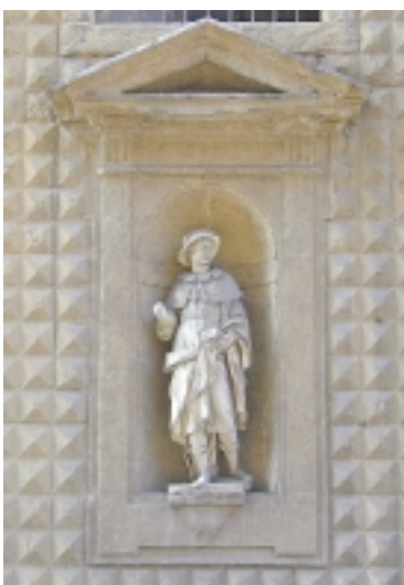
Sant'Alessio, particolare della facciata.