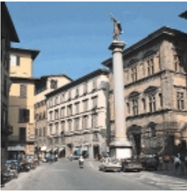
Piazza Santa Trinita.

Per proseguire, all'angolo formato da via de' Tornabuoni e da piazza Santa Trinita, si consiglia di girare di 90° verso Est, entrare nella Piazza seguendo il marciapiede, fino a trovare borgo SS. Apostoli.