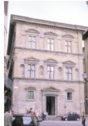
Palazzo Bartolini Salimbeni.