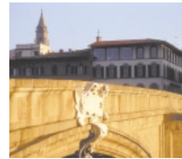
Ponte Santa Trinita, particolare del cartiglio di marmo col segno astrologico di Cosimo, nato sotto l'Ariete.

La "fierucola di San Martino" fatta di piccolo commercio e povero artigianato, era animata da tanti compratori richiamati dal coro dei venditori i quali sollecitavano a gran voce di comprare gli articoli spesso e volentieri eseguiti con le loro stesse mani.