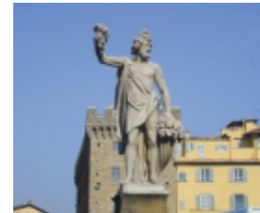
Ponte Santa Trinita: l'"Autunno" di Giovanni Caccini.