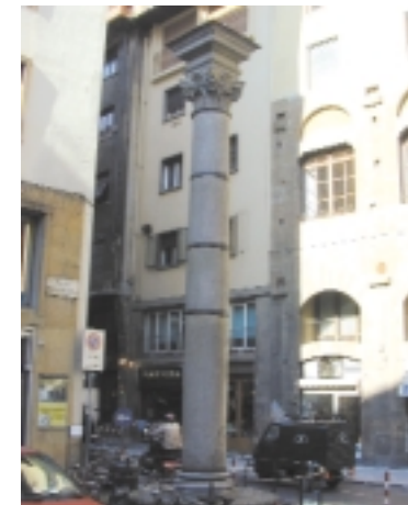
La colonna in Santa Felicita.