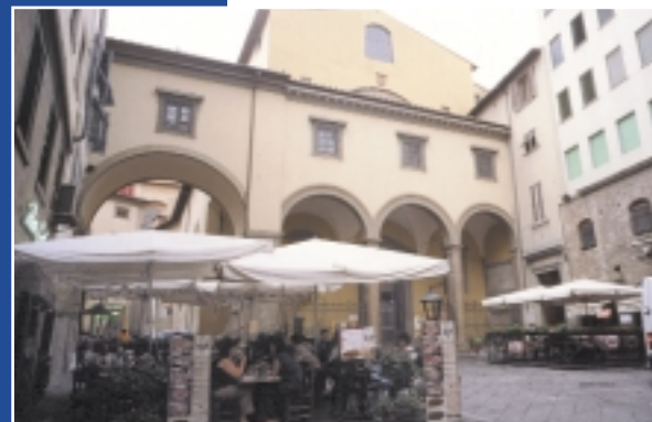
Piazza di Santa Felicita.

Appena varcato il Ponte Vecchio, sulla sinistra subito dopo aver imboccato via de' Guicciardini, si apre piazza Santa Felicita che prende nome dall'antichissima omonima chiesa sulla quale prospetta, dedicata alla patrizia romana martirizzata con i suoi sette figli ai tempi dell'imperatore Antonino Pio. Si racconta che in questo slargo, nel XIII secolo, ebbe luogo uno fra i più cruenti scontri, originato