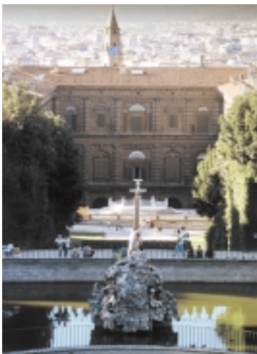
Facciata interna di Palazzo Pitti da Boboli con la Fontana del Carciofo.