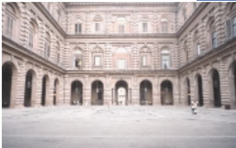
Il cortile di Palazzo Pitti.

percorso circa 50 metri. L'ingresso al Giardino di Boboli e la biglietteria si trovano in direzione Nord, camminando lungo la facciata di Palazzo Pitti.