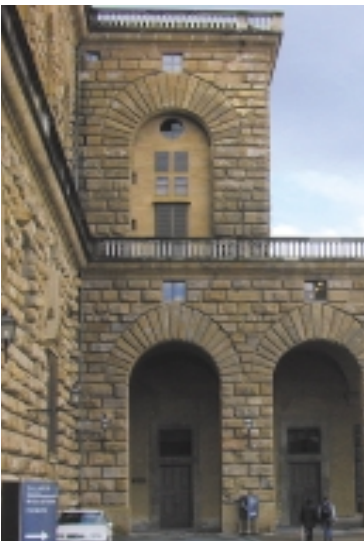
Il rondò di destra di Palazzo Pitti.

Il sontuoso palazzo è stato dimora dei Medici per circa due secoli, quindi dei Lorena e dal 1865 al 1870, durante il periodo in cui Firenze fu la capitale d'Italia, divenne reggia della sovrana famiglia Savoia. A proposito del primo re che vi abitò, Vittorio Emanuele II detto il "Re Galantuomo", si può piacevolmente osservare un bel disegno in carboncino che lo ritrae, nella parte interna del terzo pilastro del rondò a destra guardando la facciata del palazzo. Il ritratto fu eseguito nel 1861 da un soldato della guarnigione adde- detta alla sorveglianza della reggia,