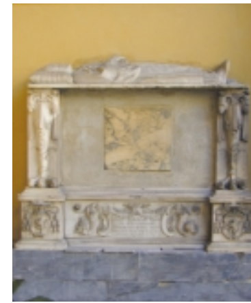
Monumento funebre del cardinale Luigi de' Rossi, sul lato destro del portico della Chiesa di Santa Felicità.

Lorena risiedevano in Palazzo Pitti. Proprio grazie alla munificenza di queste importanti presenze, che per altro assistevano assiduamente alle funzioni religiose dal "coretto" del corridoio vasariano, la chiesa venne dotata di notevoli opere d'arte. La sua singolare facciata è preceduta da un porticato a tre archi sui quali scorre il passaggio pensile del predetto corridoio. Nel portico e nell'attiguo androne che conduce al chiostro, si notano varie lapidi tombali, alcune delle quali greche e romane provenienti addirittura dall'antico cimitero paleocristiano.