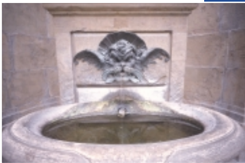
Particolare di una fontana del cortile di Palazzo Pitti.

durante le pause del servizio di ronda. Non appena il re vide l'estemporaneo capolavoro, peraltro molto rassomigliante, volle conoscere personalmente il bravo pseudo pittore, al quale concesse addirittura una promozione di grado.