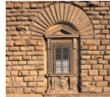
Finestra di Palazzo Pitti ornata con una testa di leone cinta dalla corona granducale.

Oggi il grandioso palazzo è importante sede espositiva della città in quanto ospita musei di fama mondiale come la Galleria Palatina, la Galleria di Arte Moderna, il Museo degli argenti e delle porcellane, nonché il Museo delle Carrozze. Si possono visitare inoltre gli Apparta-