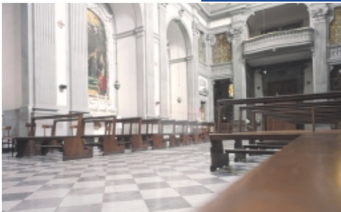
Interno della chiesa di Santa Felicita, con il "coretto", del Corridoio Vasariano.