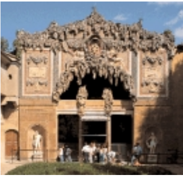
Un grottesco di Palazzo Pitti

menti reali e lo scenografico Giardino di Boboli che si estende su una vastissima area verde.