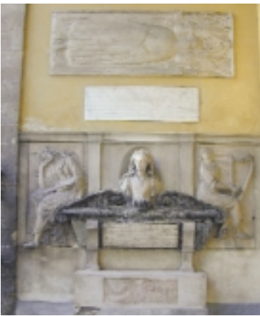
Lapidi e monumento funebre alla cantante Arcangela Palladini scolpito da Agostino Bugiardini.

Lorena risiedevano in Palazzo Pitti. Proprio grazie alla munificenza di queste importanti presenze, che per altro assistevano assiduamente alle funzioni religiose dal "coretto" del corridoio vasariano, la chiesa venne dotata di notevoli opere d'arte. La sua singolare facciata è preceduta da un porticato a tre archi sui quali scorre il passaggio pensile del predetto corridoio. Nel portico e nell'attiguo androne che conduce al chiostro, si notano varie lapidi tombali, alcune delle quali greche e romane provenienti addirittura dall'antico cimitero paleocristiano.