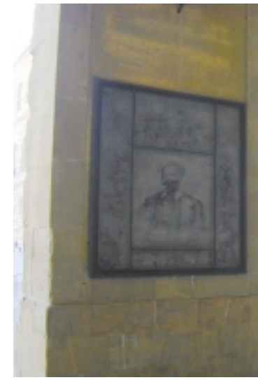
Il ritratto di Vittorio Emanuele II.

Il sontuoso palazzo è stato dimora dei Medici per circa due secoli, quindi dei Lorena e dal 1865 al 1870, durante il periodo in cui Firenze fu la capitale d'Italia, divenne reggia della sovrana famiglia Savoia. A proposito del primo re che vi abitò, Vittorio Emanuele II detto il "Re Galantuomo", si può piacevolmente osservare un bel disegno in carboncino che lo ritrae, nella parte interna del terzo pilastro del rondò a destra guardando la facciata del palazzo. Il ritratto fu eseguito nel 1861 da un soldato della guarnigione adde- detta alla sorveglianza della reggia,