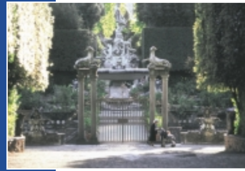
Fontana dell'Isolotto nel giardino di Boboli.

Definito "una reggia all'aria aperta", il Giardino di Boboli è universalmente considerato il tipico esempio di giardino all'italiana. Ricco di piante di vario genere, adornato da fontane e grotte, scalinate e prati digradanti, fu ideato e realizzato da Cosimo I de' Medici con l'aiuto di Niccolò Pericoli detto il Tribolo, poi continuato dall'Ammannati, dal Buontalenti ed, infine, da Alfonso Parigi.