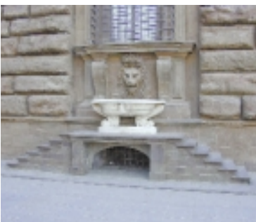
Fonte del Leone: posata su sei gradoni sotto l'ultimo finestrone a sinistra del palazzo.

quecento Buonaccorso Pitti fu costretto a vendere il gioiello di famiglia a Cosimo I de' Medici, che l'acquistò per la consorte Eleonora di Toledo, dando subito l'incarico a Bartolommeo Ammannati di eseguire lavori di ampliamento. Con i grandi interventi dell'Ammannati l'austero, signorile palazzo, si trasformò in una vera e propria reggia, alle spalle dell'immenso Giardino di Boboli. Altri lavori continuarono nel 1620 ad opera di Giulio Parigi e venti anni dopo dal figlio di questi Alfonso, che completò il palazzo prolungando la facciata nel modo come og-