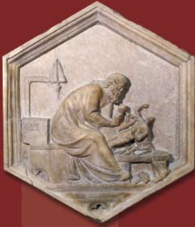
Fidia o La Scultura, formella dal basamento del Campanile di S. Maria del Fiore, attribuita ad Andrea Pisano (1337-48) Firenze, Museo dell'Opera del Duomo

Un ringraziamento speciale all'Opera di Santa Maria del Fiore per le immagini che ci ha fornito e un omaggio agli scalpellini della sua bottega che, nel corso dei secoli, hanno realizzato le decorazioni scultoree e architettoniche della cattedrale e del campanile e che ancora oggi con lo stesso amore si dedicano al mantenimento e alla conservazione di questo inestimabile patrimonio.