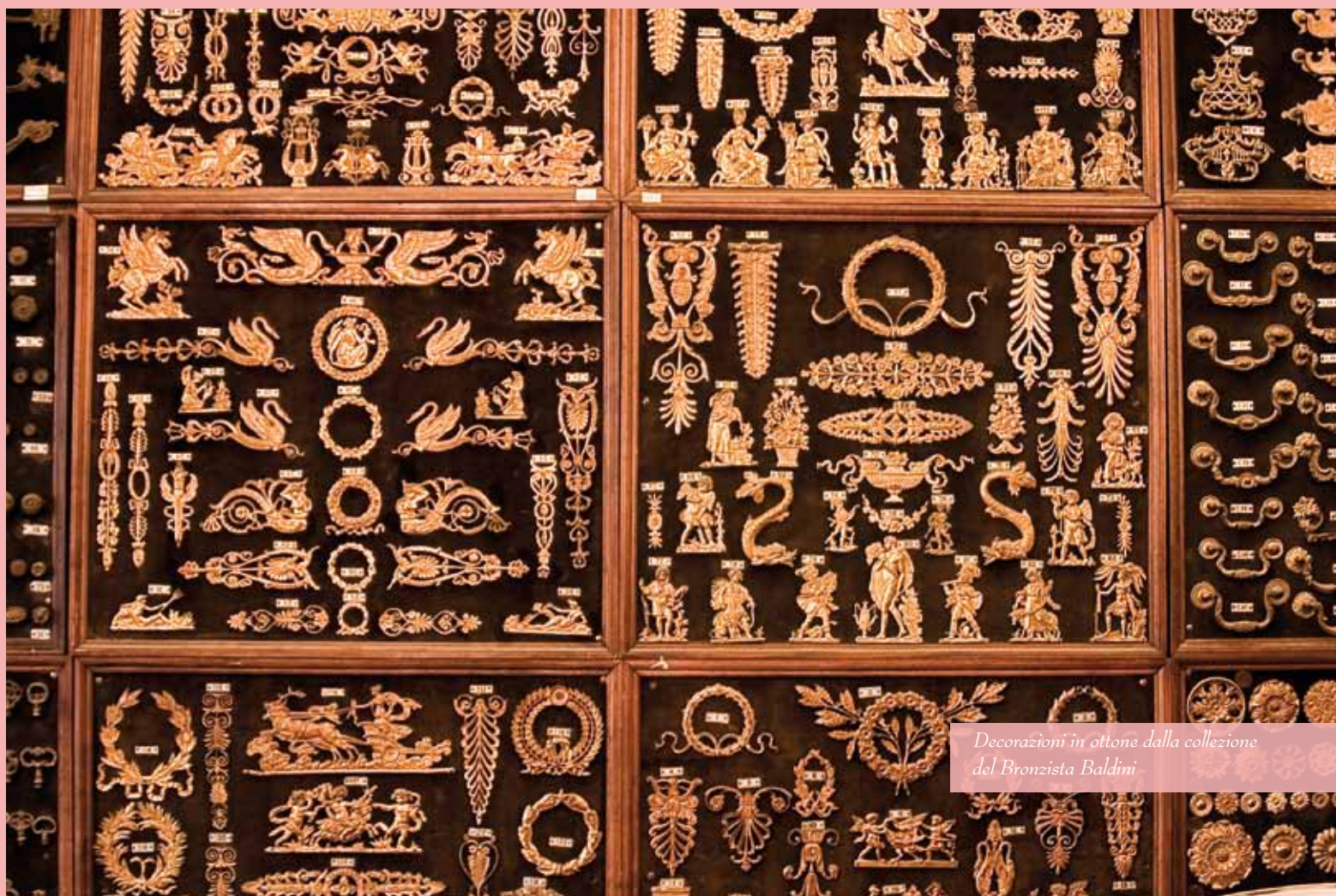
Decorazioni in ottone dalla collezione del Bronzista Baldini