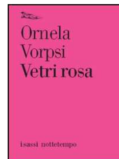
Ornela Vorpsi Vetri rosa (Nottetempo, 2006)